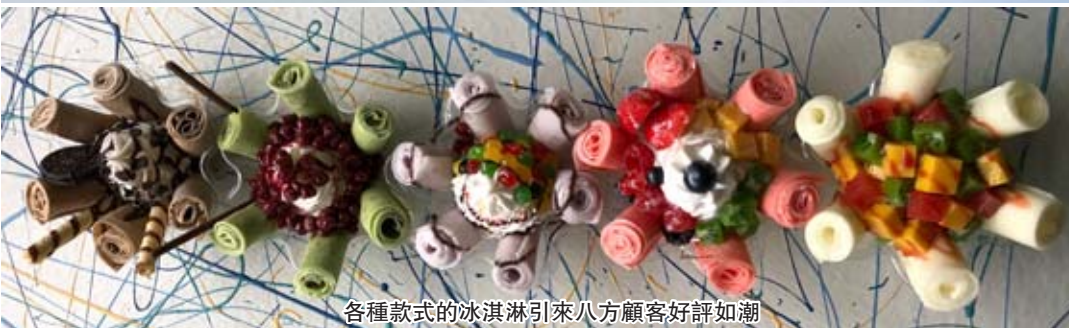
各種款式的冰淇淋引來八方顧客好評如潮