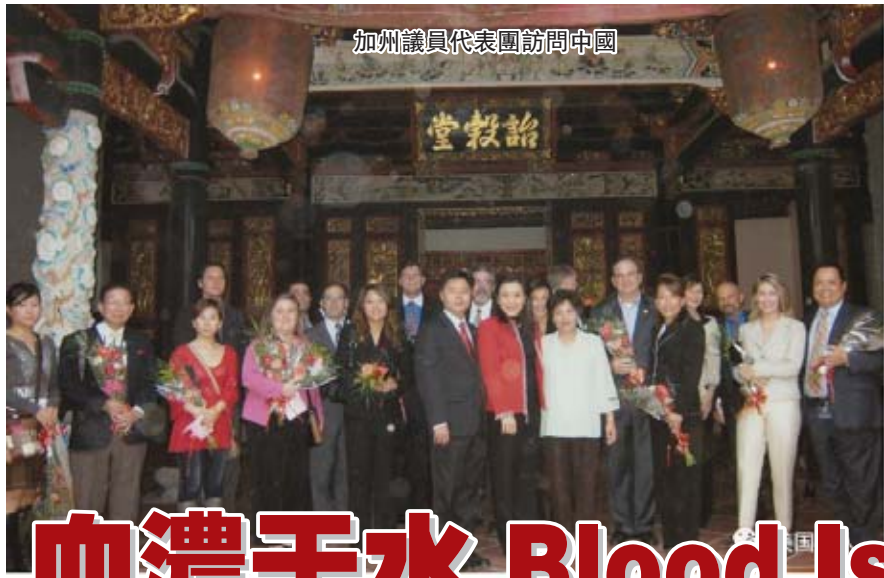
加州議員代表團訪問中國