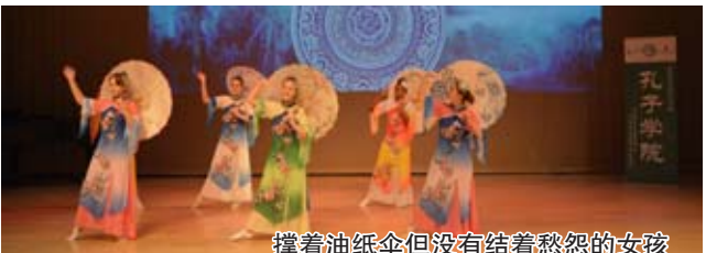
撑着油纸伞但没有结着愁怨的女孩