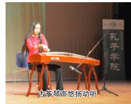
古筝琴声悠扬动听

事亦被大家称之为孔子学院的“我要上春晚”。据悉,本场比赛吸引了68个节目报名注册,参演人员一百余人,亲友团达数百人。比赛的成功举办,表明孔子学院的影响力在不断攀升,表明中国文化的吸引力越来越大。