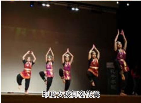
印度女孩舞姿优美