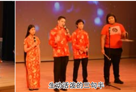
生动活泼的三句半