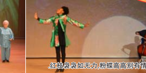
红枝袅袅如无力,粉蝶高高别有情