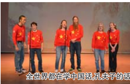
全世界都在学中国话,孔夫子的话越来越国际化