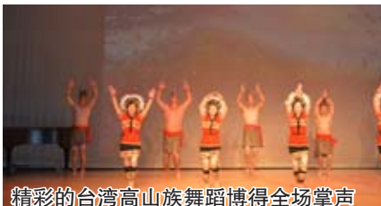
精彩的台湾高山族舞蹈博得全场掌声