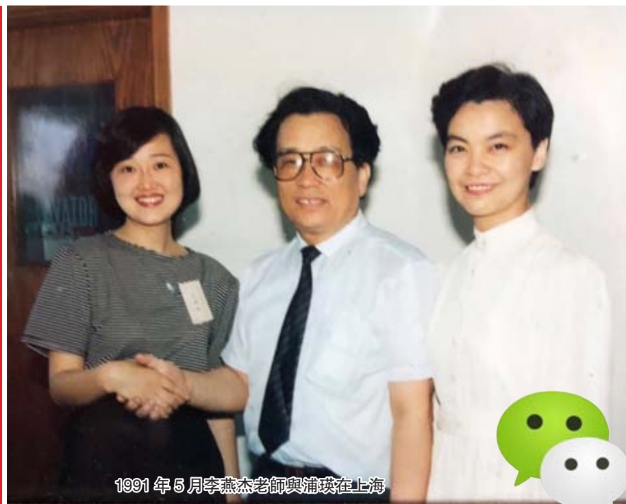
1991年6月李燕杰老師與浦瑛在上海

微信讓世界變小了，讓朋友走近了。11月18日，我在微信群看到一位姓名吳方臣先生發了一則訃告：中國第一位德育教授，多次受到黨和國家領導人接見和表揚的，當代最偉大的演講教育藝術家，受到社會各界人士尊敬的人民教育家、社會活動家、愛國演講家、大眾書法家、國學家、文學家、詩人、作家，中國共產黨最忠誠的共產主義戰士李燕杰教授，於2017年11月16日晚17:58分，因患癌症醫治無效在北京不幸逝世，享年88歲。