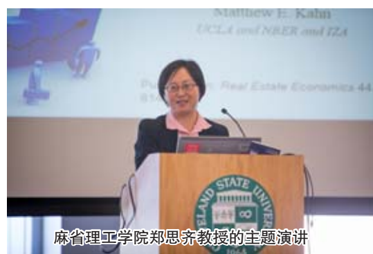
麻省理工学院郑思齐教授的主题演讲

主题演讲,她建立了中国35个城市房地产信心指数,用于预测房价升值和新住房销售情况,并找到了住房投资者信心异质性取决于城市人口结构和城市住