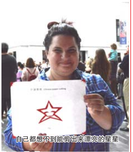
自己都想不到能剪出来漂亮的星星