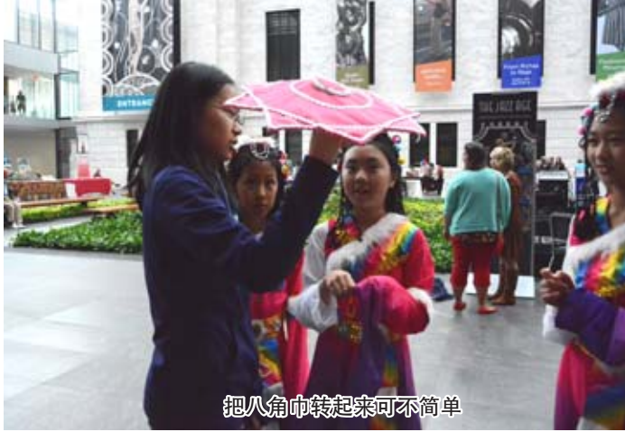
把八角巾转起来可不简单