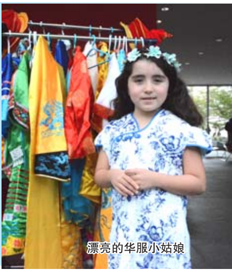
漂亮的华服小姑娘