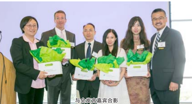
与会发言嘉宾合影

下午,来自参会专家学者、业界人士共同参加了全球房地产市场发展分论坛,进行了深入探讨。