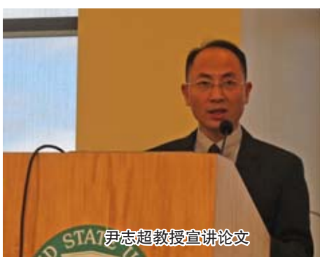
尹志超教授宣讲论文