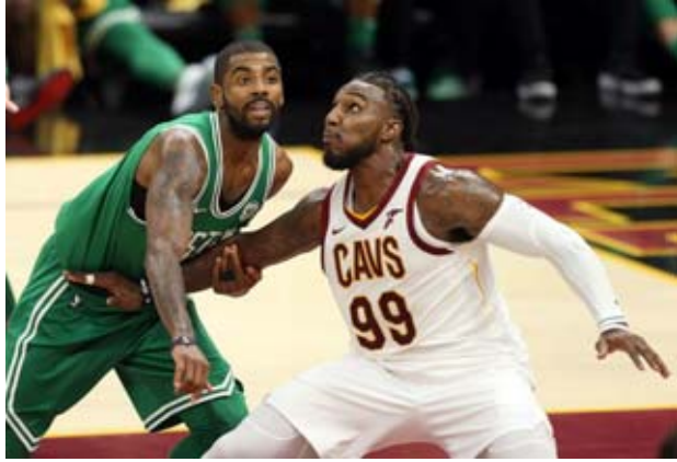
好了撤遠了，言歸正傳。雖沒人太在乎首場比輸贏，但騎士遠不該在一度領先 18 分而表現懶散被追趕成最後的僵局。賴凱爾特人也沒想到主力海沃德(Hayward)在場上的過早意外，不僅給本場輸球定局而且其首場左踝關節骨折損失的後果也太大了。展望新季，儘管騎士有太多的工作要做，但衛冕東部冠軍好象不是太大的問題。還是老聲常談，挑戰西域，翹首以待。

好在一周後，NBA2017-08 常規賽開打!東部最熱門隊克里夫蘭騎士對波士頓凱爾特人今晚按期相遇，騎士球館媒體球迷爆滿。看點不在比賽本身而在本賽季之前的隊員轉會大買賣風波不斷。歐文(Irving)轉去凱爾特人而換來 Isaiah Thomas (湯馬斯), Jae Crowder (克勞德), 和 Ante Zizic 之後騎士馬不停蹄又買進 Derrick Rose(德里克·羅斯), 和 Dwyane Wade(德