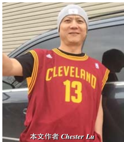
本文作者 Chester Lu