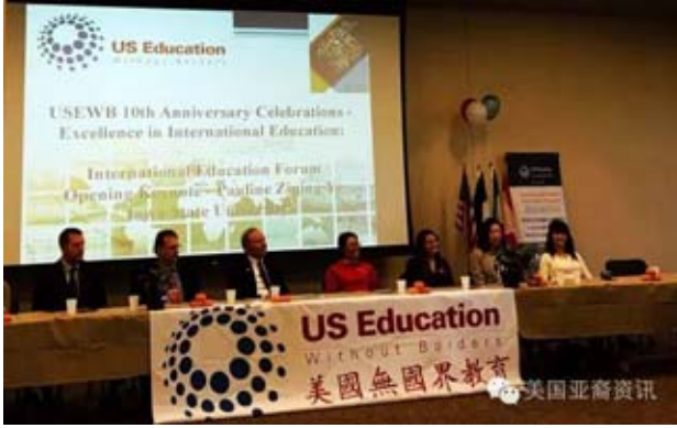
【美國亞裔新聞(AANB)】“留學生如何面對語言、文化的挑戰?”“和寄宿家庭如何融洽相處?”“怎么申請適合自己的大學?”這些都是留學生們,特別是美國高中留學生面對的焦點問題。

10月22日,美國無國界教育(US Education Without Borders)舉辦創立十周年紀念活動,將教育話題論壇作為紀念活動的重頭戲,特邀十多名來自美國多所大學以及商界、法律界代表,參加了和三十多名留學生的交流研討(下圖)。之後又舉行了頒獎典禮、國際文化展、聯歡晚會等豐富多彩的活動。