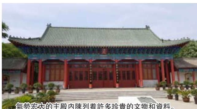
氣勢宏大的主殿內陳列着許多珍貴的文物和資料。