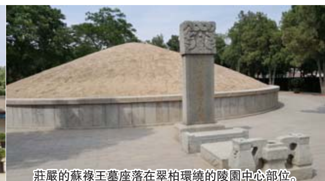
莊嚴的蘇祿王墓座落在翠柏環繞的陵園中心部位。