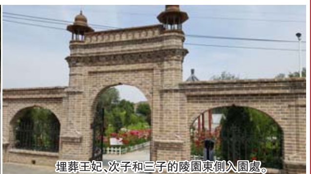
埋葬王妃、次子和三子的陵園東側入園處。