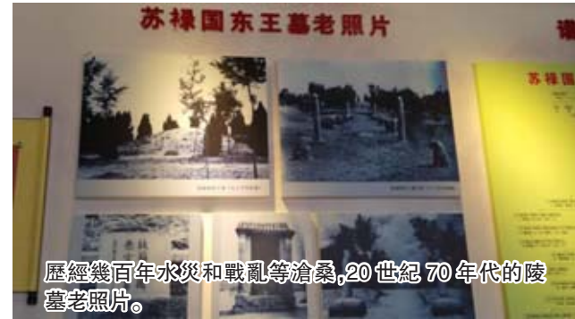
歷經幾百年水災和戰亂等滄桑，20世紀70年代的陵墓老照片。

親仁善鄰，是中國千年傳承的優秀傳統；世世友好，是我們歷代追求的共同願望。蘇祿王墓是中菲友誼的象徵，也是山東省