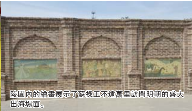
陵園內的繪畫展示了蘇祿王不遠萬里訪問明朝的盛大出海場面。