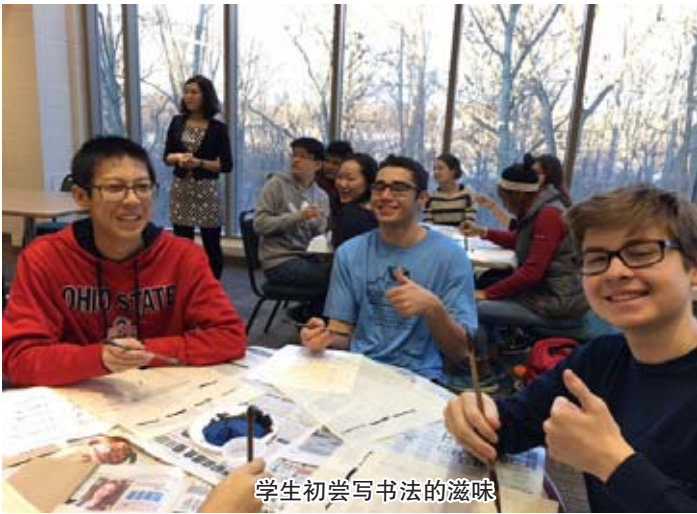
学生初尝写书法的滋味