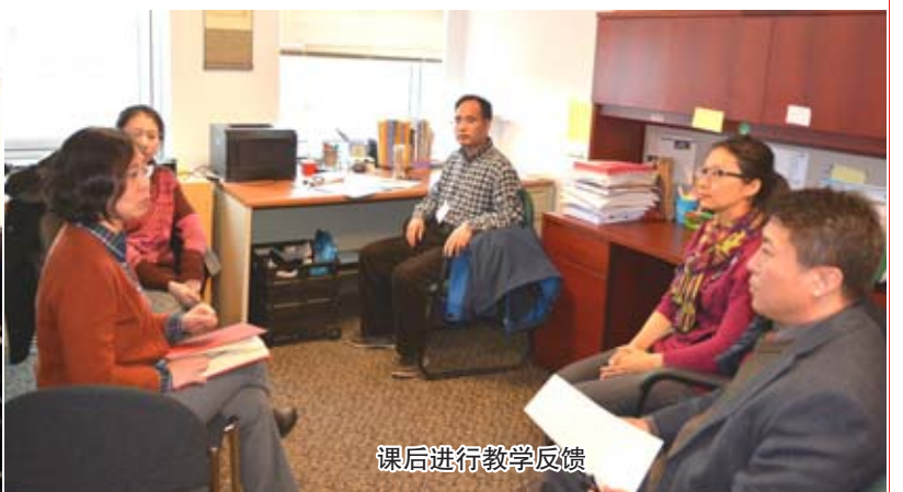
课后进行教学反馈