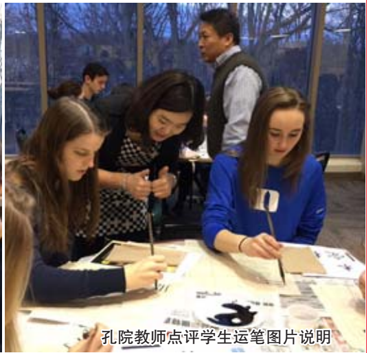
孔院教师点评学生运笔图片说明