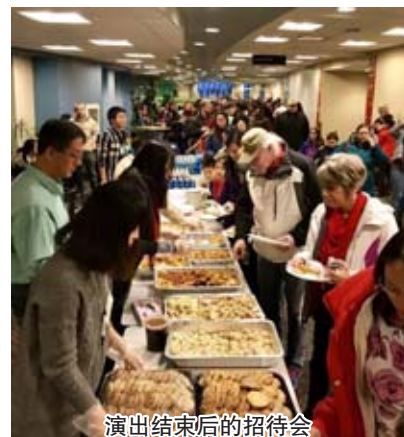
演出结束后的招待会