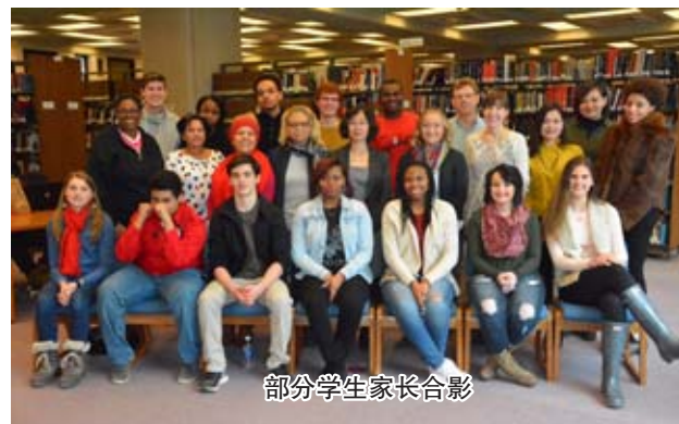
部分学生家长合影