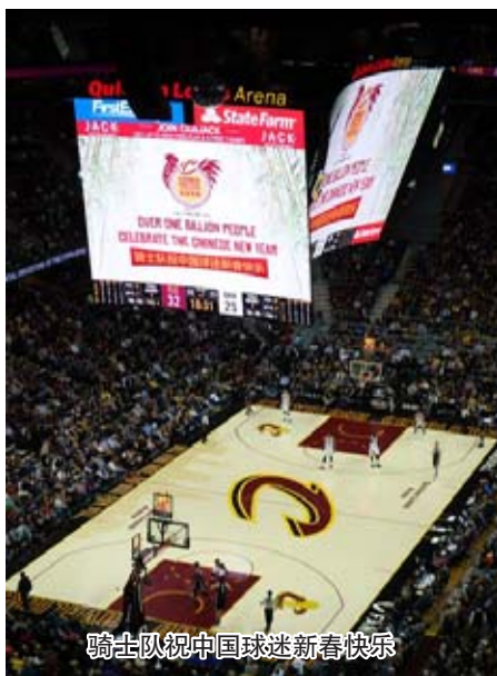
骑士队祝中国球迷新春快乐

本次活动旨在进一步加强孔子学院与当地主流团体的合作、进一步促进普通民众对中国文化和中国社会的了解。孔子学院在速贷球馆设有三个展台,两个为书法展台、一个文化体验台;其中一个书法展台应骑士队要求而设,特别为骑士队季票球迷取中国名字,体验展台为中国传统服饰试穿展台,涵盖了小礼品发放、孔院课程、文化项目宣传等,展台外,憨态可掬的“大熊猫”与球迷互动频频。展台前观众络绎不绝,每一个孔院教师一个顶俩用,忙