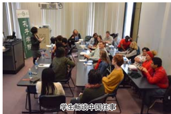
学生畅谈中国往事

当地时间农历正月初八(2月4日)克利夫兰州立大学孔子学院以一台由当地学区和民众、华人华侨参与表演、风格多元的节目和招待会欢庆中国春节。值此中国文化氛围浓厚之际,孔子学院邀请了2015年和2016年参加国家汉办组织的“汉语桥美国高中生夏令营”活动的部分学生和家,同庆佳节、共叙中国往事。