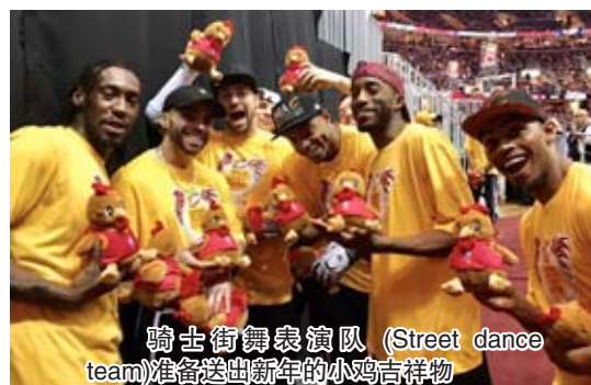
骑士街舞表演队 (Street dance team)准备送出新年的小鸡吉祥物

本次活动旨在进一步加强孔子学院与当地主流团体的合作、进一步促进普通民众对中国文化和中国社会的了解。孔子学院在速贷球馆设有三个展台,两个为书法展台、一个文化体验台;其中一个书法展台应骑士队要求而设,特别为骑士队季票球迷取中国名字,体验展台为中国传统服饰试穿展台,涵盖了小礼品发放、孔院课程、文化项目宣传等,展台外,憨态可掬的“大熊猫”与球迷互动频频。展台前观众络绎不绝,每一个孔院教师一个顶俩用,忙