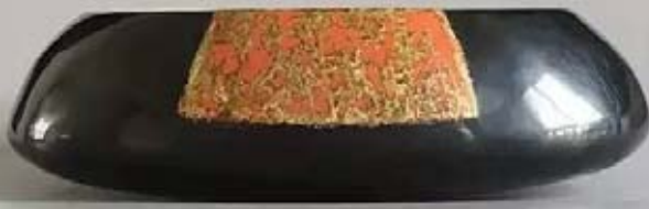
張麗紅 (圖 2)

早前，她更是跑遍了福建的諸多個脫胎漆器廠、福建漆藝研究中心(研究所)以及相關漆藝的材料加工點，深入瞭解漆材料和漆工藝。