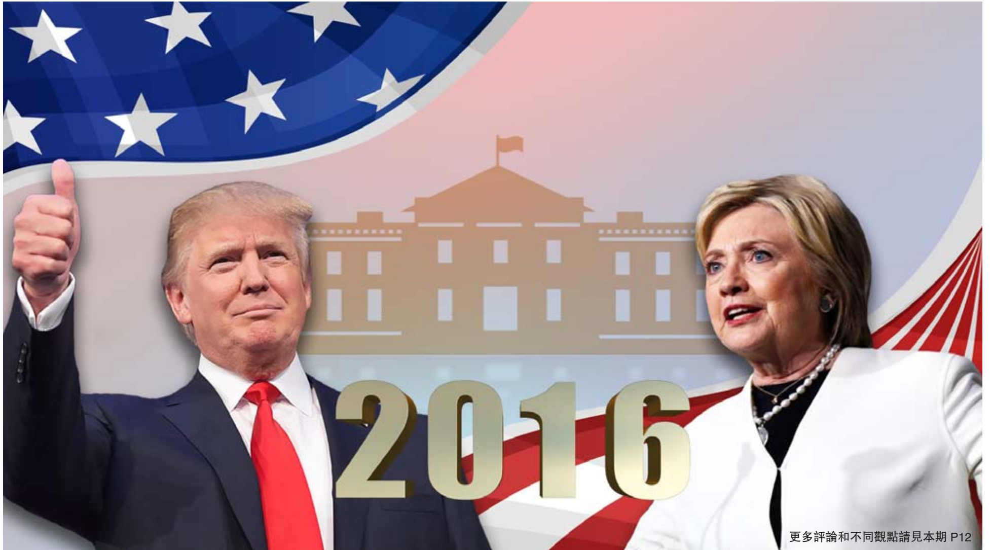
更多評論和不同觀點請見本期 P12

相信不少關心美國政治和國家前途、命運，關心如何改變美國經濟、人民生活的安危、對內對外政策和華人參政的華裔朋友觀看了 9 月 26 日晚上的首次總統大選的現場辯論，代表民主黨參選的總統候選人希拉里·克林頓與代表共和黨參加的候選人唐納德·特朗普唇槍舌劍在億萬美國人民面前各自闡述自己的觀點和治國之道，至於這場辯論中誰更勝一籌，不同的黨派不同的媒體和不同的支持者當然有着不同的解讀……。