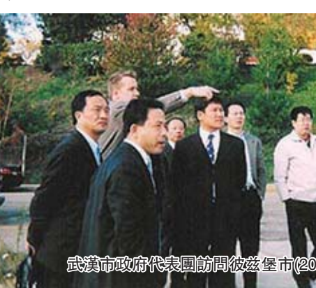
武漢市政府代表團訪問匹茲堡市(2004 年)

業發展起來，形成了以高技術產業為主導，冶金、生物製藥、化工、計算機、信息、金融等多元化的產業結構。90 年代以來，匹茲堡通過加強城市基礎設施，改善投資環境吸引外資。目前有 220 家外國公司在匹茲堡設有代表機構。德國拜耳等 100 多家外企將美國總部設在匹茲堡。2009 年美國 500 強企業中有 8 家將全球總部設在該市，美國 500 強總部數量全美排名第 8。